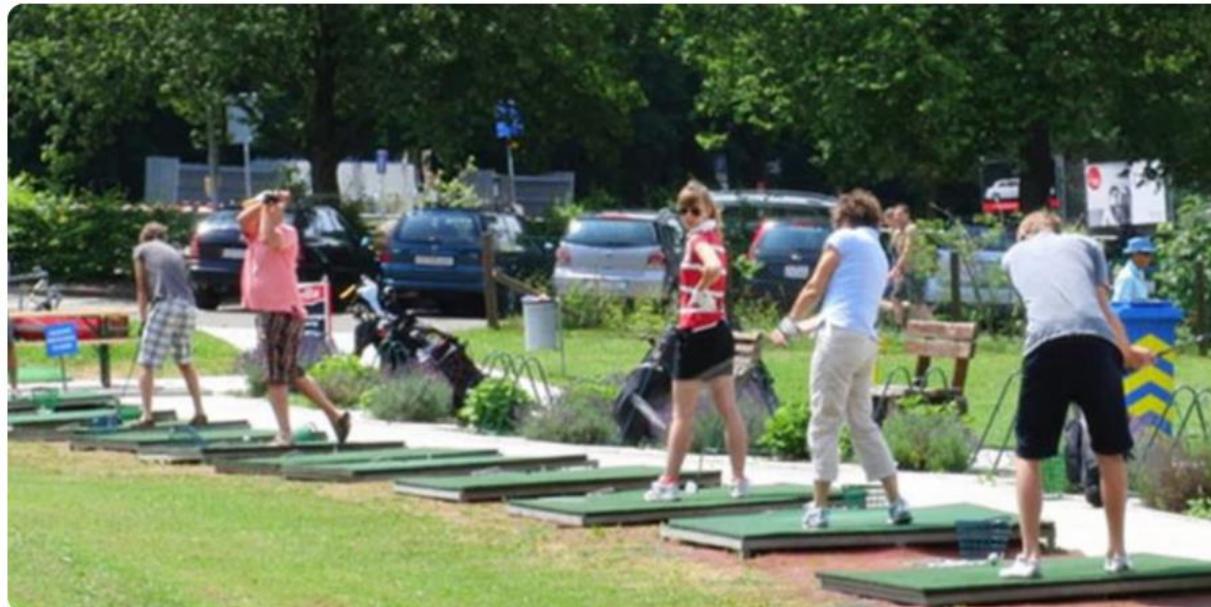
Die Driving Range in Adlisberg ZH.

Die Betreiberin der bekannten Driving Range in Adlisberg ZH befürchtet das Aus der Anlage. Zu weit fliegende Golfbälle sind seit langem ein Konfliktpunkt.